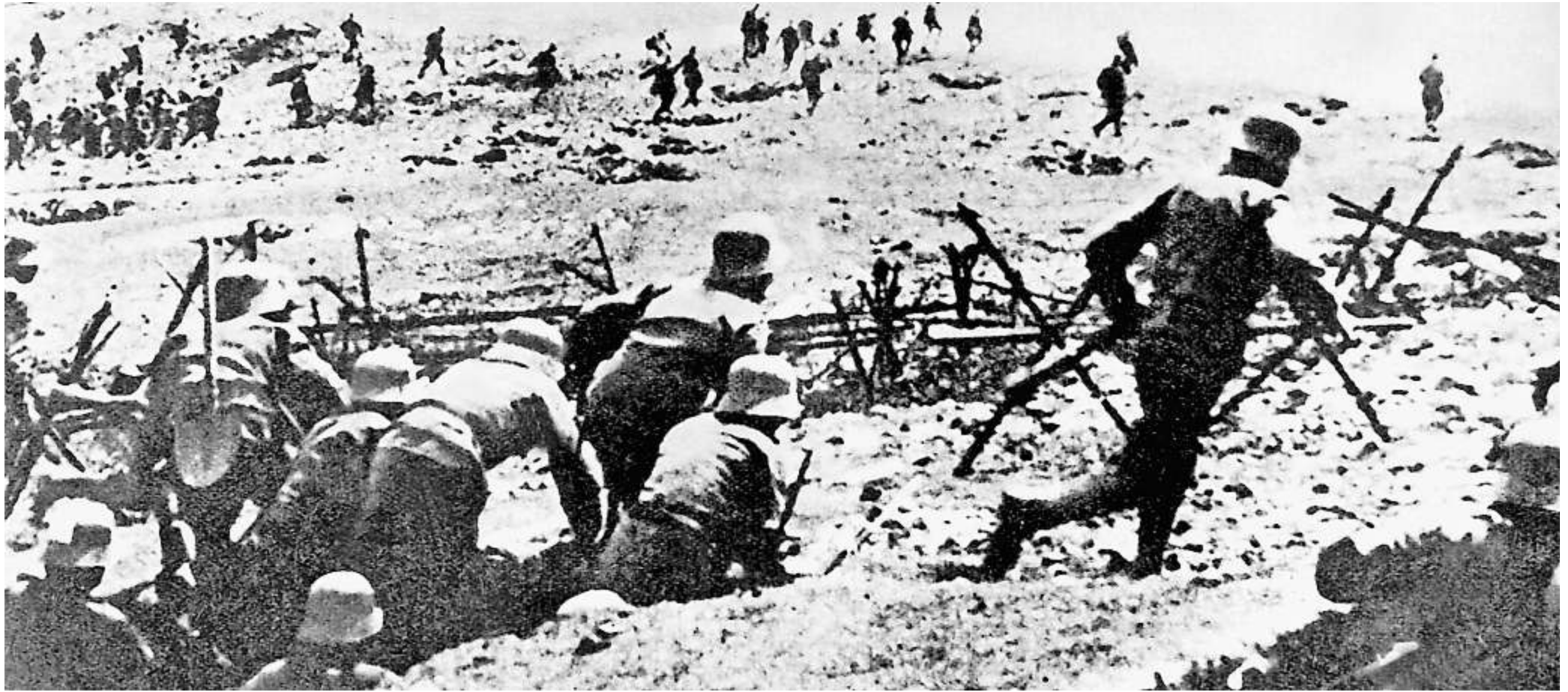
Sturmangriff aus dem Schützengraben: Ganze Kompanien wurden im Kugelhagel der Maschinengewehre aufgerieben.