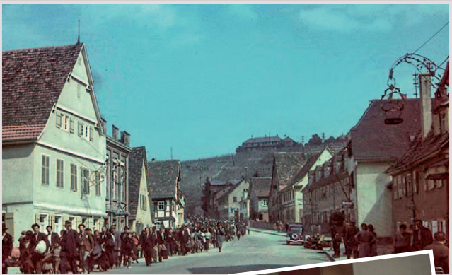
Asperg: Deportation deutscher Sinti- und Roma-Familien im Mai 1940

Zudem wird die Geschichte der Überlebenden im Nachkriegsdeutschland, die erst spät als NS-Opfer anerkannt wurden, beleuchtet. Es war die Bürgerrechtsbewegung der deutschen Sinti und Roma, die die ideologischen und personellen Kontinuitäten aus der Zeit des „Dritten Reichs“ zum Gegenstand einer gesellschaftlichen Debatte gemacht hat. Am Ende der Ausstellung steht ein Ausblick auf die Menschenrechtssituation der Sinti- und Roma-Minderheiten in Europa nach der Wende 1989.