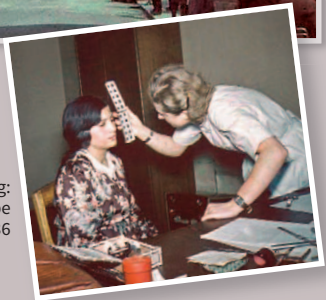
Rassenforschung: Bestimmung der Augenfarbe 1936