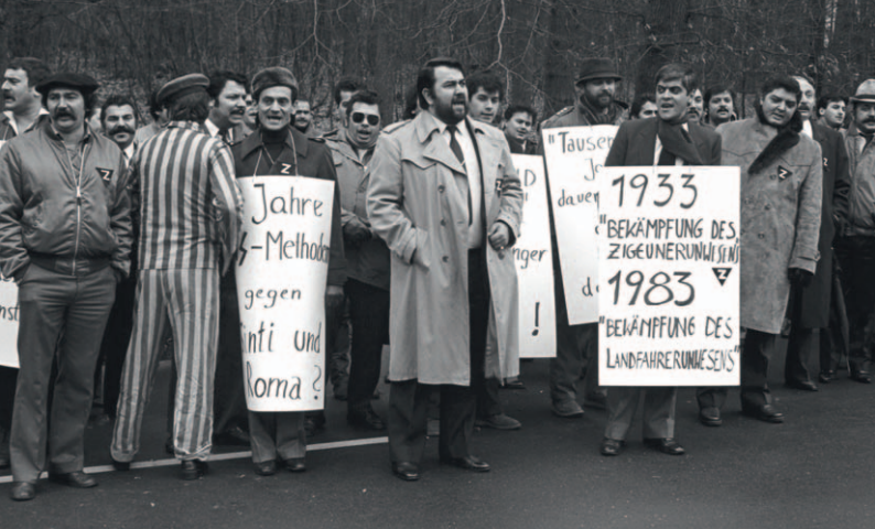
Demonstration des Zentralrats Deutscher Sinti und Roma vor dem Bundeskriminalamt in Wiesbaden gegen die Sondererfassung von Sinti und Roma durch die Polizei, 28. Januar 1983.

Zudem wird die Geschichte der Überlebenden im Nachkriegsdeutschland, die erst spät als NS-Opfer anerkannt wurden, beleuchtet. Es war die Bürgerrechtsbewegung der deutschen Sinti und Roma, die die ideologischen und personellen Kontinuitäten aus der Zeit des „Dritten Reichs“ zum Gegenstand einer gesellschaftlichen Debatte gemacht hat. Am Ende der Ausstellung steht ein Ausblick auf die Menschenrechtssituation der Sinti- und Roma-Minderheiten in Europa nach der Wende 1989.