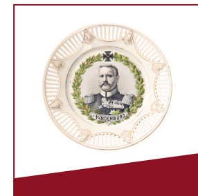
Wandteller Der populärste deutsche Heerführer war Hindenburg.