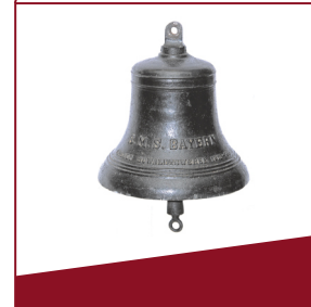
Schiffsglocke Diese Glocke stammt vom Schlachtschiff „Bayern“.