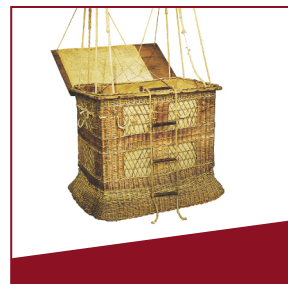
Ballonkorb Fesselballons dienten als Beobachtungsplattform.