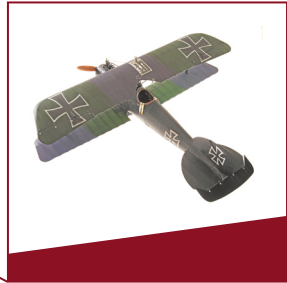
Flugzeugmodell Jagdflugzeug Albatros D V von 1917.