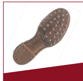
Stiefel Die Sohlen der Militärstiefel waren mit Nägeln beschlagen.