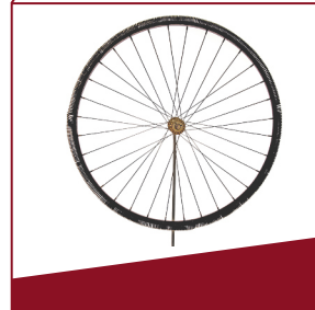
Fahrradreifen aus Draht Gummi war knapp. Hier ersetzt ihn eine Drahtspirale.