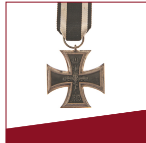
Eisernes Kreuz Eine Kriegsauszeichnung wird zum nationalen Symbol.