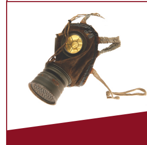
Gasmasken Seit 1915 gehörten Gasmasken zur persönlichen Ausrüstung.